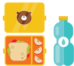
Ланч-бокс і пляшка для води